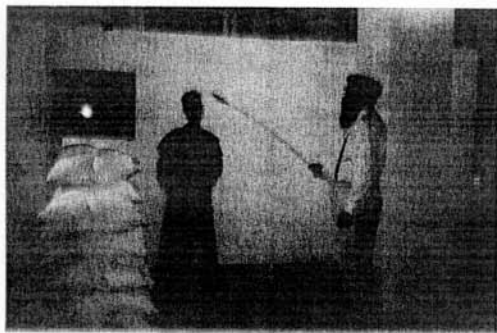
HARDIJA LEDINA UN NSRD PERFORMANCE RIETUMBERLINE, 1998